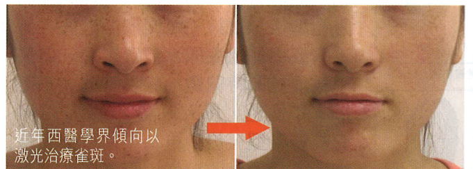
近年西醫學界傾向以激光治療雀斑。