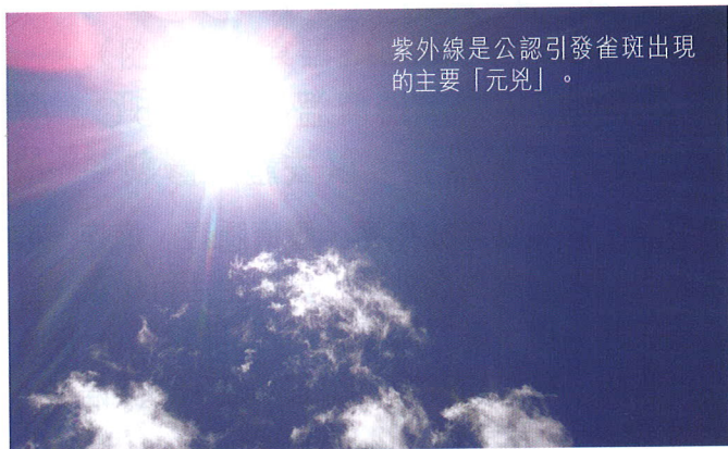
紫外線是公認引發雀斑出現的主要「元兇」。

我在整理黃褐斑及雀斑的資料時，突然想起了一個成語故事，含有黃雀兩個字，雖然與色斑無關，但覺得有趣，不妨順手拈來，說給大家聽聽，以加強對黃褐斑及雀斑兩集內容的記憶，此句成語就是「黃雀銜環」。成語出自《續齊諧記》。